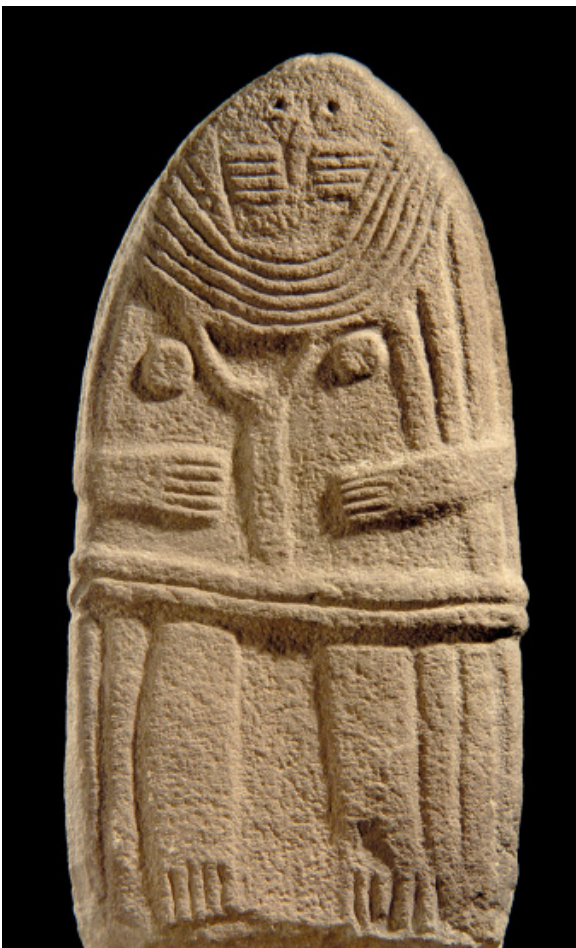
La Dame de Saint-Sernin... une statue-menhir sculptée il y a 5000 ans et exposée au musée Fenaille.